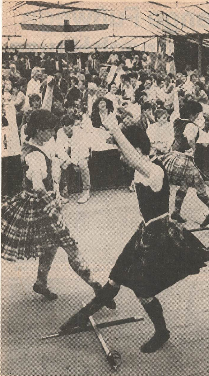
Über den gekreuzten Säbeln tanzten die anmutigen Mädchen aus Hennefs Partnerstadt Banbury zu einer alten schottischen Weise für die Besucher des Festabends in Stadt Blankenberg.