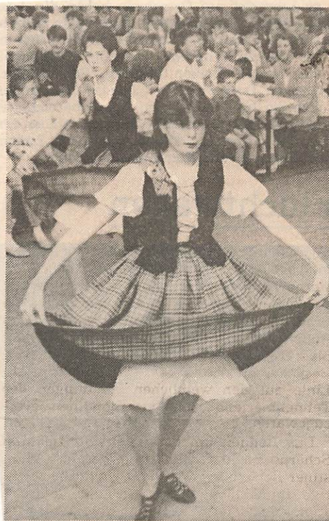
LIESSEN DIE ROCKE schwingen: Die Folklore-Tanzerinnen aus Banbury.

Am Sonntagmorgen gestalteten die Musiker aus Banbury den Gottesdienst. Es erklang Musik von Franz Schubert, und an Stelle der Orgel begleiteten die Bands die Gesange der Gemeinde im Festzelt. Beim anschlieenden Platzkonzert spielten die Musiker aus der Partnerstadt zum Fruschoffen auf der Festwiese auf. Hubschrauberfluge uber das