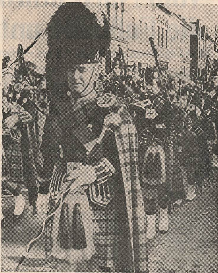
DUDELSACK-SPIELER aus der Partnerstadt Banbury waren eine der Attraktionen beim Hennefer Karnevalszug.

Der Geistinger Winzerverein nahm Bezug auf den tragischen Tod eines Obdachlosen an der