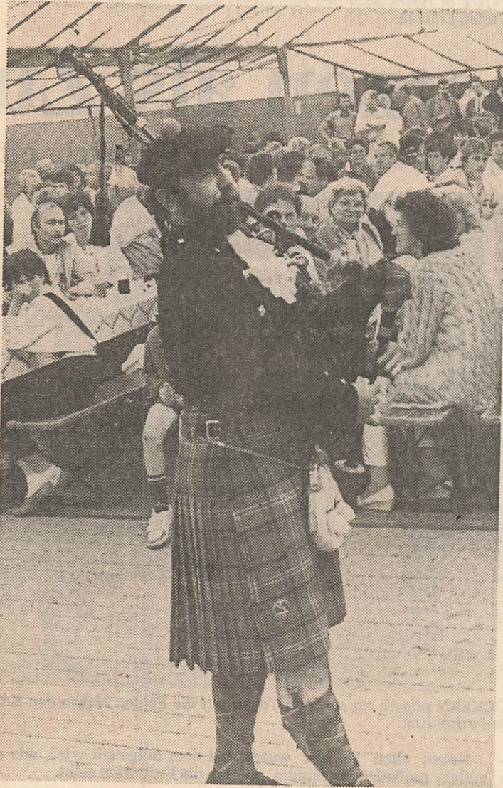
EIN DUDELSACK-SPIELER aus der englischen Partnerstadt Banbury gehörte zu den Attraktionen beim Festball anlässlich des Blankenberger Burgfestes.

Tausende drängten sich wieder auf dem Flohmarkt der Burgstadt